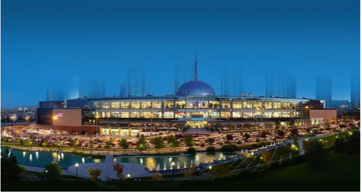
----- PANORA Alışveriş ve Yaşam Merkezi Oran/ANKARA -----

Şirketimiz portföyünde 2007 yılında tamamlanarak faaliyete geçen PANORA Alışveriş ve Yaşam Merkezi bulunmaktadır. Gayrimenkule ilişkin bilgi ve görseller aşağıda sunulmuştur.